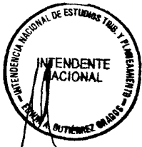
NAHIL LILIANA HIRSH CARRILLO Superintendente Nacional SUPERINTENDENCIA NACIONAL DE ADMINISTRACION TRIBUTARIA